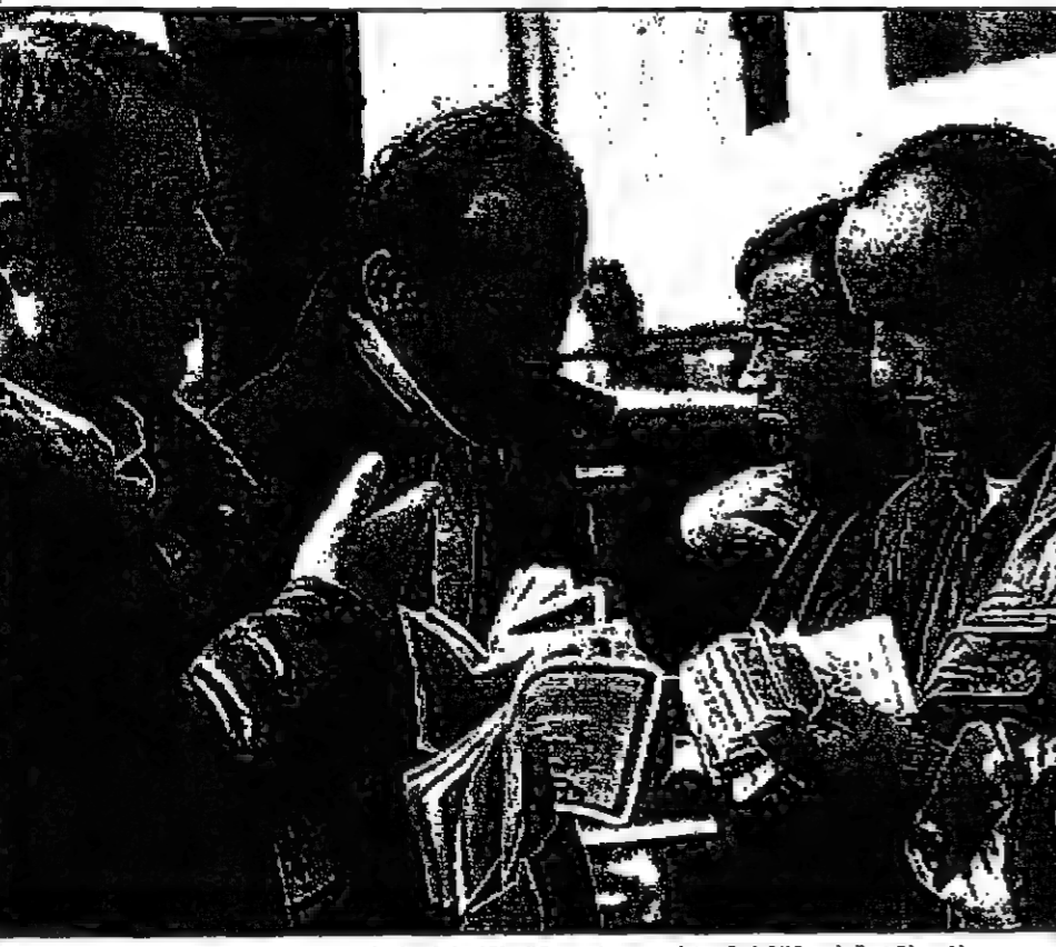
سراة علة في العاصمة اللبنانية بيروت حيث مبيعات قيمة العملة المحلية بشكل كبير مع ضيق مبيعات من اموال الاربعة الذين وقروا حصة الشركات الاربعة لاستثمار الاموال التي اديتها الى تعميم الأزمة الاقتصادية والسياسية في البلاد

القدس-رويترز: اقترح وزير النقل الاسرائيلي اسحق ليفي طرح اسهم الحكومة بالكامل في شركة طيران العال للربح في السوق المحلية لكنه قال ان طائرات الشركة يجب الا تحلق في ايام السبت. وقال ليفي ان الشركة ستحلق طائراتها في ايام السبت.